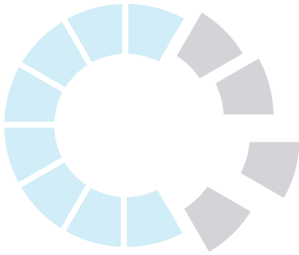
Tabel 3: Strafrechtelijk gevolg uithandengeving